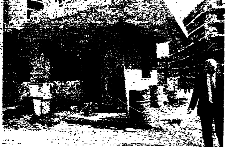
السيد حنين أمام البيات المدمر